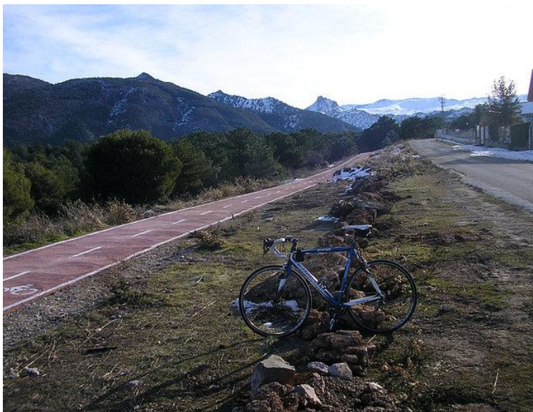
Panorámica del Carril Bici en su tramo final

Circuito de asfalto de 160m Las líneas rojas indican el lugar dónde se disputarán las carreras.